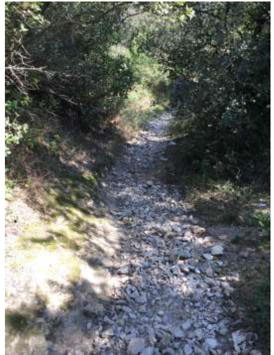
Sentier accès au plateau, débouchant près des viaducs TGV