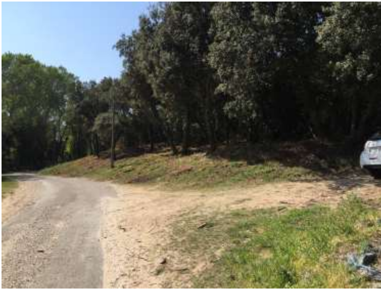
Sur le chemin de la Tuilerie, accès à sentier (photo à droite)